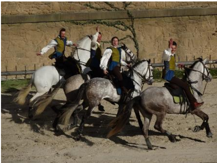
Au Puy du Fou